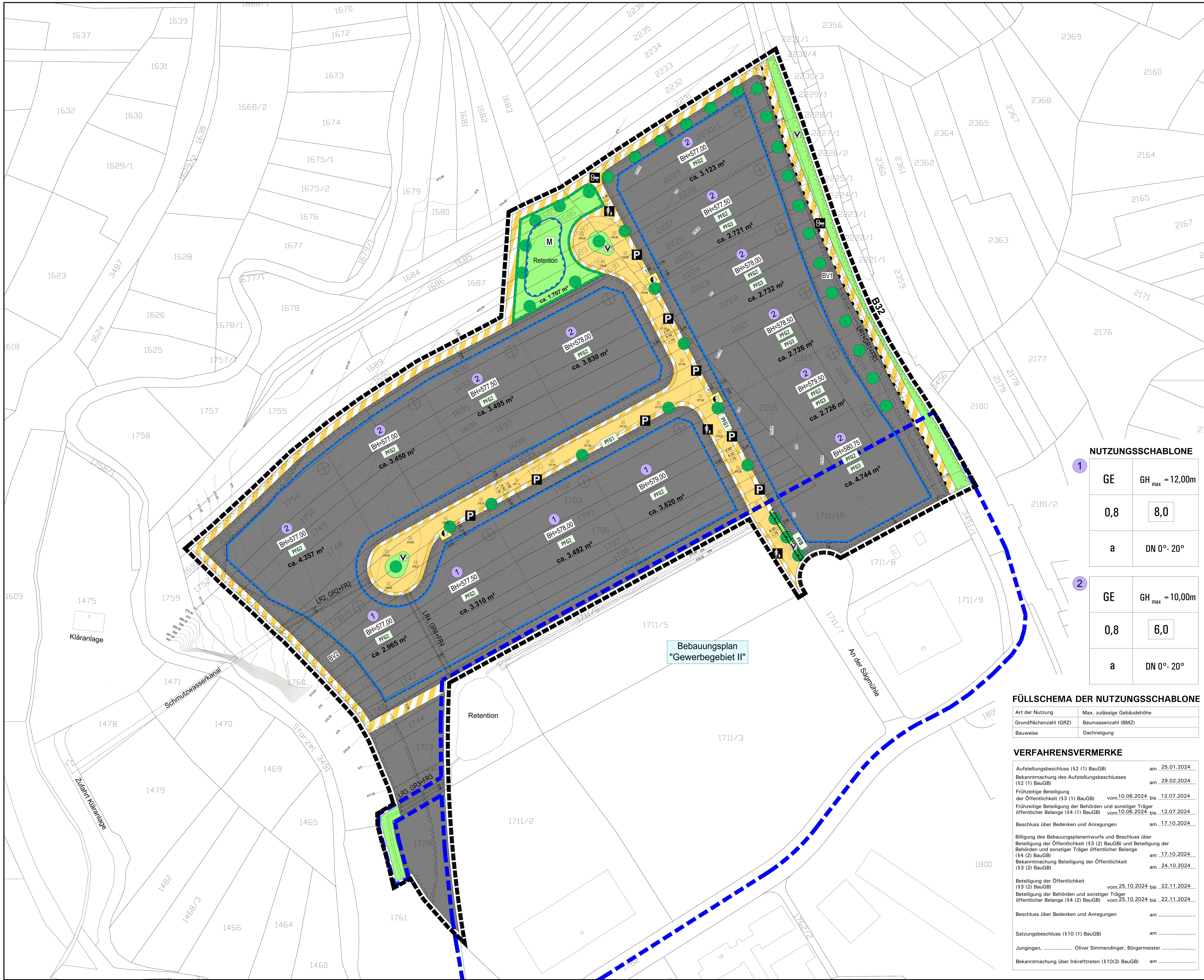
Bebauungsplan "Gewerbegebiet II"